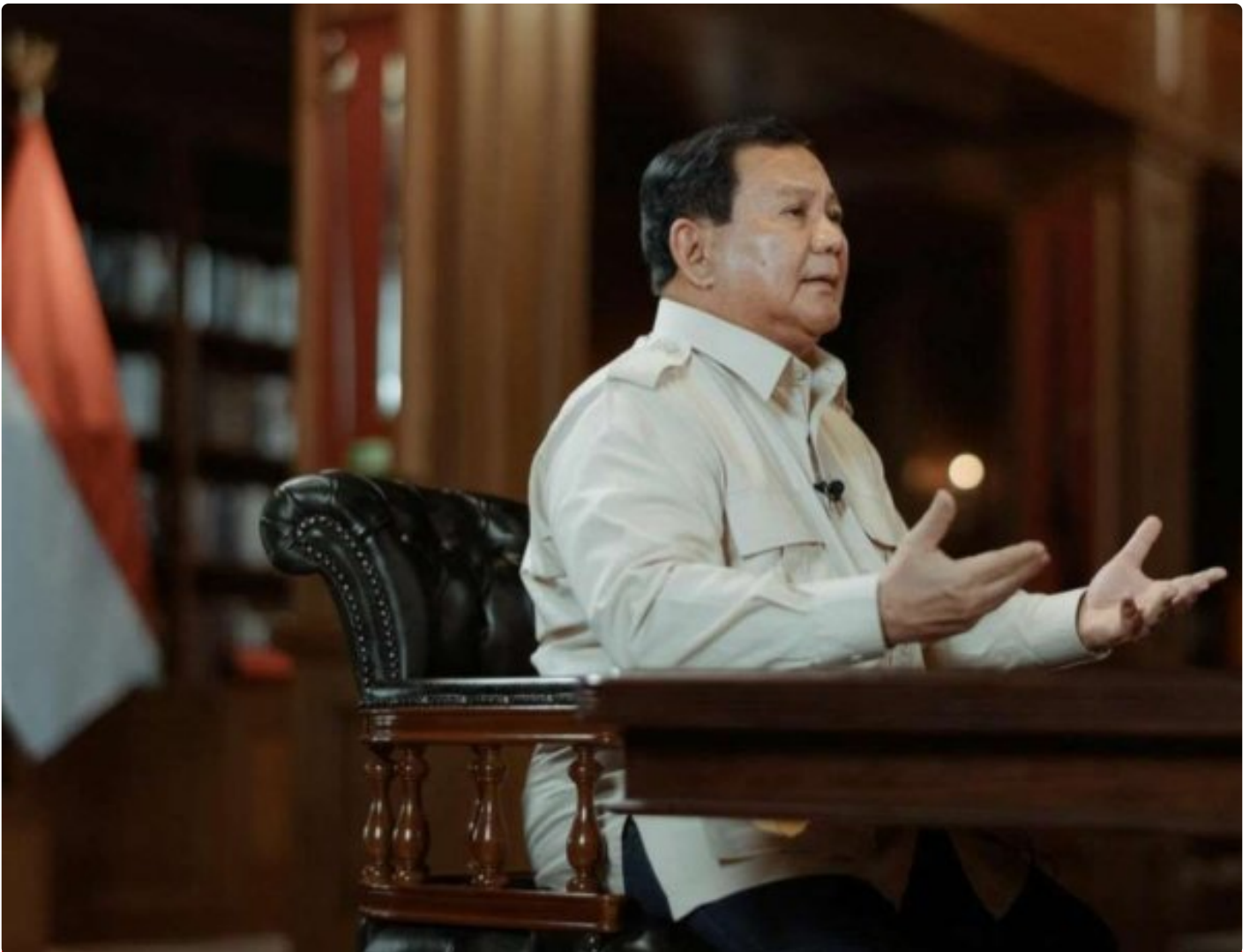
Prabowo Subianto Presiden RI 2024-2029

PENDIDIKAN - Indonesia dikenal sebagai negara yang kaya akan sumber daya alam . Dari hasil tambang yang berlimpah, laut yang luas dengan kekayaan hayati yang melimpah, hutan yang menjadi paru-paru dunia, hingga sumber daya energi yang tersebar di berbagai wilayah, semuanya menjadi kekuatan besar bagi bangsa ini. Potensi besar tersebut seharusnya dapat dimanfaatkan untuk membangun masa depan yang lebih cerah, termasuk mewujudkan pendidikan gratis